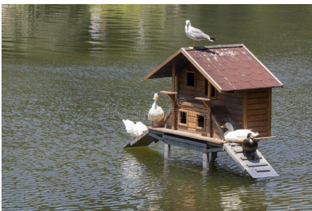
Artist impression van de nieuwe Meervaart met het huidige budget

Toen al hoorden wij van deskundigen dat bouwen in de Sloterplass niet zou lukken voor dat budget, zeker niet als men denkt aan het geprojecteerde model in het water. Maar mogelijk speelt mee dat de gemeente geen grondkosten heeft want het water van de Sloterplass is gratis.