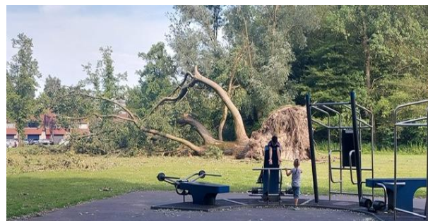
Stormschade Sloterpark 5 juli 2023 Windkracht 11 met uitschieters

Ook op de valreep: onze website heeft het deze week begeven, er is een nieuwe in voorbereiding!