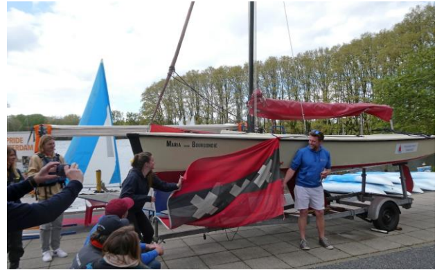
Tekst en foto Wouter van der Wulp

Met een open dag op zondag 21 april startte Watersportcentrum Sloterplas het vaarseizoen. Een feestelijk hoogtepunt daarbij was de doop van een van hun zeilboten.