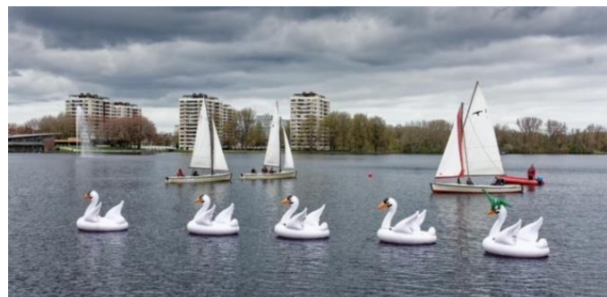
Ook protesteerden de zwanenvloot en het monster (op de laatste zwaan) van de Sloterplas met ons mee

Op 11 maart was hierover een informatiebijeenkomst in het kerkgebouw de Opgang aan de Tussenmeer waarbij de wethouders Van Dantzig en Meliani ook aanwezig waren bij de presentatie van de plannen. Er werden veel kritische vragen gesteld maar de wethouders zelf blijven bij hun plannen maar laten de beslissing over aan de Gemeenteraad.