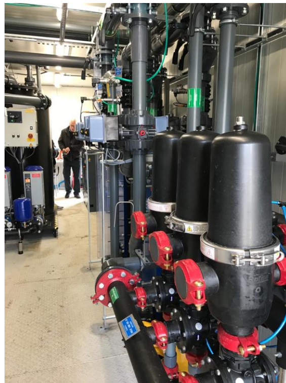
TEO-station- proefinstallatie achter de houten omheining nabij strand café Buiten

Voor wie meer wilt weten of er niet bij kon zijn, zie de informatie over dit project: Onderzoek naar effect van TEO op het leven in oppervlaktewater | Waterschap AGV. Te zijner tijd zullen de onderzoeksresultaten ook hier geplaatst worden.