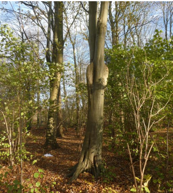
Tekst en foto Wouter van der Wulp

In ons Sloterpark valt telkens weer wat nieuws te ontdekken. Ik moet er al vele malen langsgekomen zijn, zonder dat het me ooit opgevallen was. En toen opeens zag ik het: Olifantsoren.