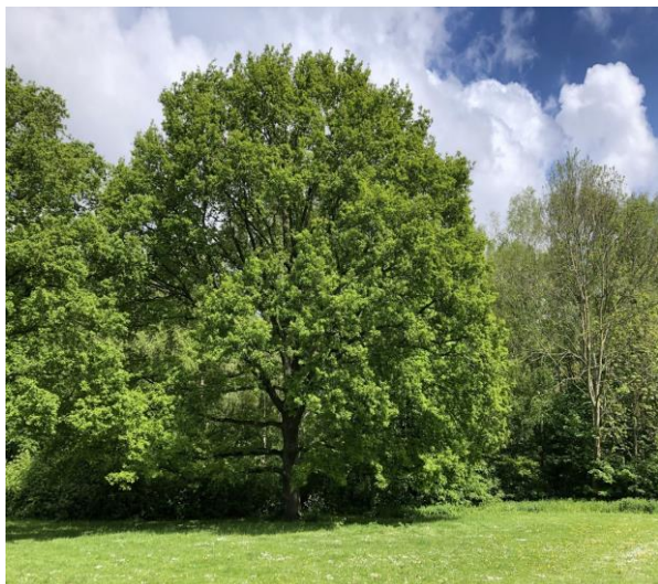
Zomereik mei 2021 – omgewaaid januari 2024