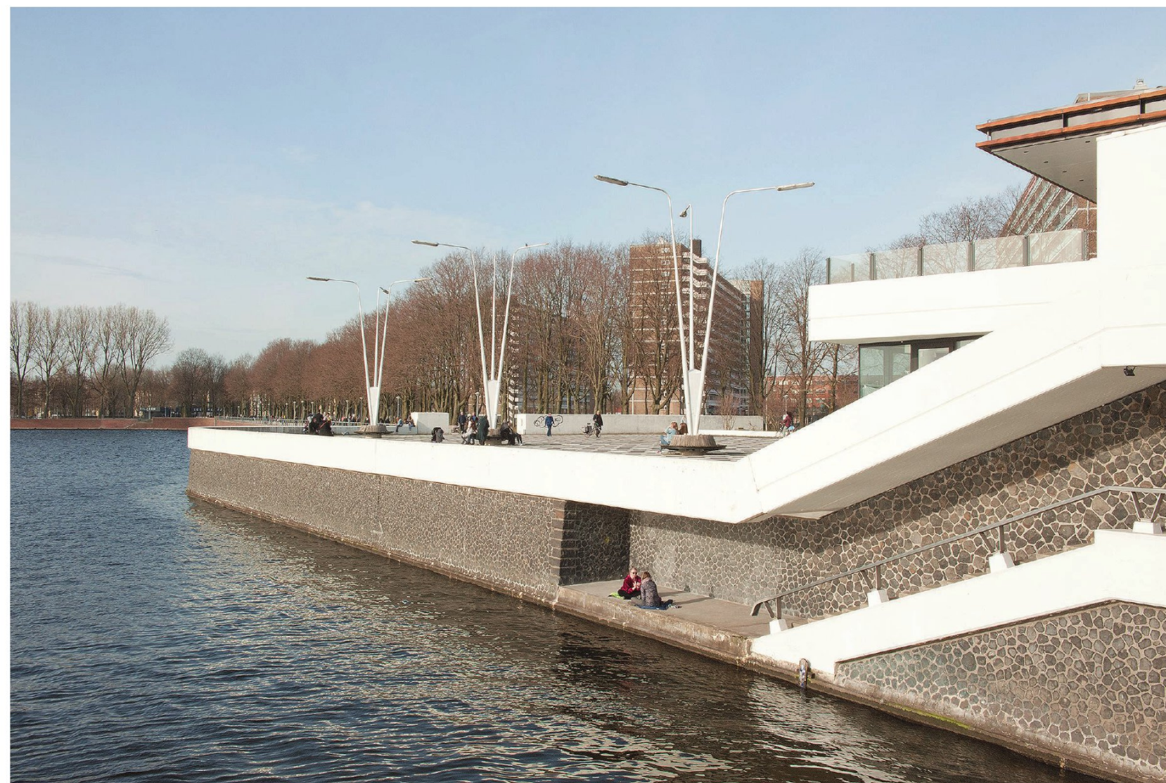
Restaurant Oeverzicht, gevestigd in het paviljoen Oostoever.

'Nergens is er een plek waar je het geheel kunt overzien'