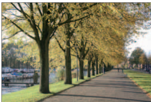
35. Jachthaven met bastions

Het noordelijke deel van het zwembadeiland werd in 2011 aangepakt. Het braakliggende terrein van het gesloopte oude zwembad werd vergraven tot een nieuwe gracht, de Sloterparkbadsingel. Deze is voorzien van natuurlijke oevers en een aanlegsteiger. De bestaande Sloterparkbadlaan kreeg een nieuw tracé, waarbij ook het in 1961 door Egbert Mos ontworpen zeshoekige bastion onderdeel van het parkterrein werd. Op een van de twee zeshoekige voormalige kinderbadjes is een horeca-voorziening gepland. Langs het fietspad staat het stalen kunstwerk 'Twee Stekelroggen' van Egbertje Kiewiet uit 1982.