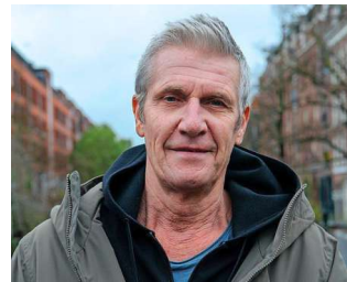
...Evenals Nico van Gog. Beiden ondersteunen de bewoners rond het stadsdeelkantoor.