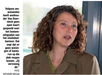
Volgens omwonenden heeft wethouder Van Doorninck geen open kaart gespeeld over het bestemmingsplan van het stadsdeelkantoor. Dat zegt dat er geen woningen of kantoren op die plek mogen komen. Zij verzwegen dit.