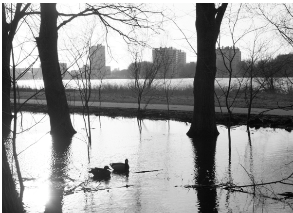
Eenden in het ondergelopen park. In de verte: Torenwijk; 9 maart 2007.

De omwonenden zijn geschokt. Met e-mails en telefoontjes zijn wij en het stadsdeel bestookt.