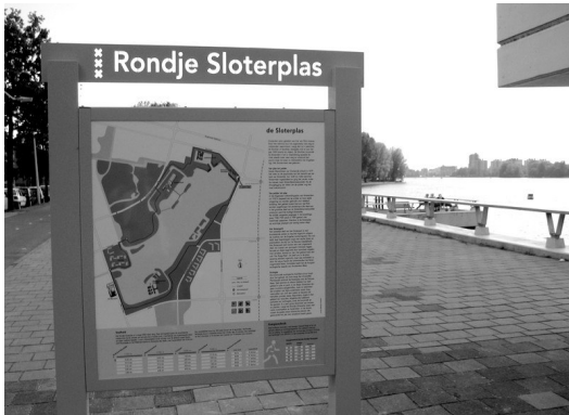
Nieuwe infopanelen Rondje Sloterpark

O.a. is aan een skatepark bij het Volten kunstwerk en een beeldentuin gedacht.