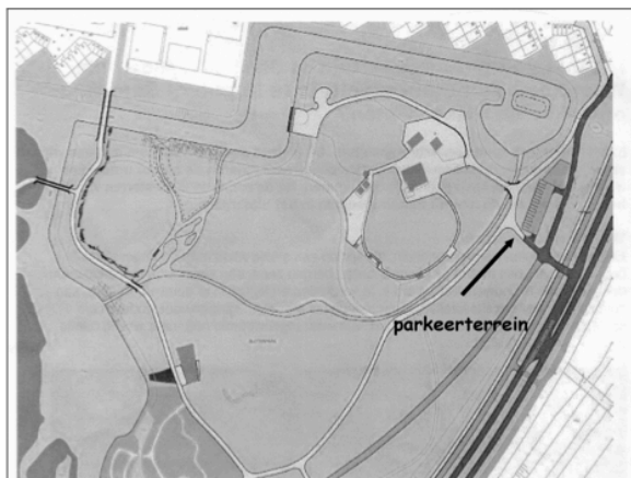
Plangebied Natuurspeeltuin incl. toekomstige waterafscheidingsen

Positief is het behoud van groen en natuur in dit gedeelte van het park, negatief het onttrekken van openbaar groen aan het park, omdat een deel van de natuurspeeltuin niet vrij toegankelijk zal zijn. Ook de serene uitstraling van dit gedeelte van het park gaat verloren