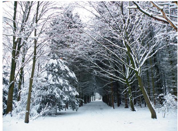
Sloterpark winter 2010

Op het zwembadterrein, bij het bastion aan de noordkant, liggen twee ondiepe zeshoekige baden van het voormalige openluchtbad, bij het bastion aan de noordkant van het zwembad. Op de fundamente van die baden zal een (kleinschalige) horecavoorziening worden gemaakt: de Vuurkorf. Daarom is het al jaren verwaarloosde groen eromheen, wat voornamelijk bestond uit oude populieren, wildgroei en populierenopschot, weggehaald. Ons werd verteld dat niets van het groen te gebruiken was. Er is een nieuw ontwerp gemaakt voor de inrichting van het park om de Vuurkorf.