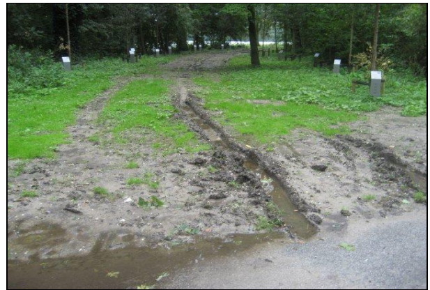
De "laan" van de voormalige deelraad Geuzenveld-Slotermeer draagt sporen van haar eigen verdienste