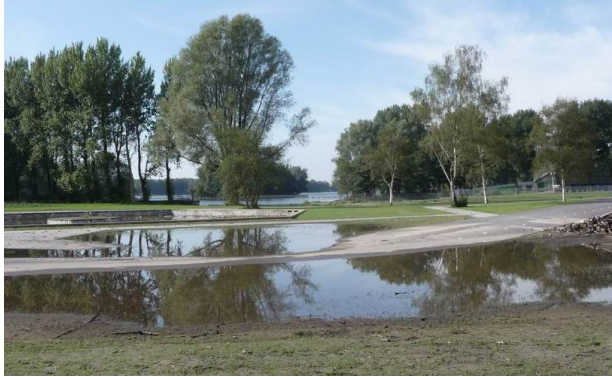
Het nieuwe fietspad tussen Noorderhof en zwembad

best aardig. Maar die meterslange kuil moet uit het fietspad. Gelukkig heeft het stadsdeel de aannemer al opgedragen in en rond deze badkuip de boel op te hogen. Vervolgens komen er nog nieuwe bomen en lantaarnpalen. Als alles goed gaat, komt er dan eind dit jaar een feestelijke opening. We hopen dus dat dat feestje niet toch nog in het water valt, en blijven het met u in de gaten houden. Want zolang de wateroverlast niet is verholpen, zal het oude fietspad moeten blijven.