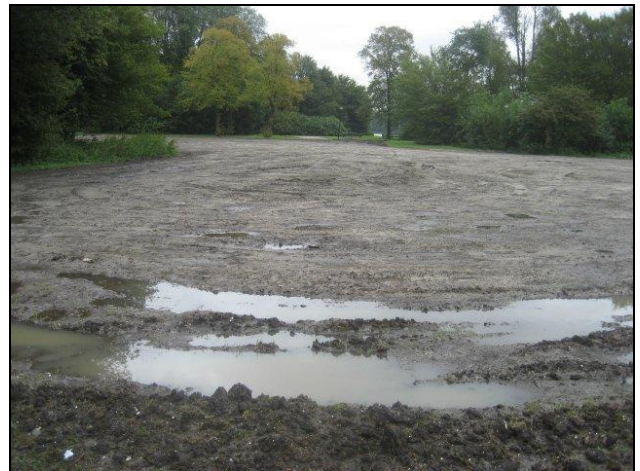
Voor 13 augustus was dit gras

Wat er gebeurt met het park als het regent tijdens het Loveland Festival, hebben we deze zomer kunnen beleven. De afdeling Groen, ook erg geschrokken van de ravage, heeft daags nadat de boel was opgeruimd de modderpoelen met aarde gevuld zodat de gazons er na vier weken uitzagen als omgeploegde akkers (zie bovenstaande foto's).