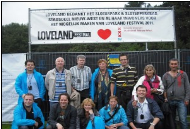
Optimistische afvaardiging van de deelraad op de voorpagina van de Westerpost 17 augustus 2011

Bestuur en Raad van stadsdeel Nieuw-West worden "bedankt" voor het verlenen van de vergunning, voor de enorme geluidsoverlast en het vernielen van het Sloterpark door het Loveland Festival 2011!