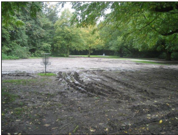
Ook "bedankt" namens de Disc-Golf spelers