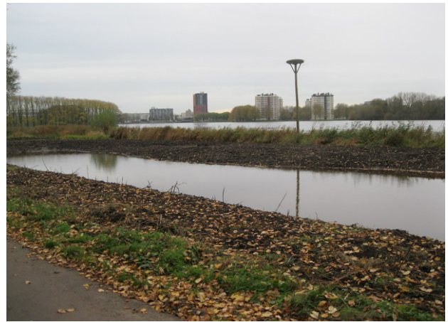
Het nieuwe poeltje aan de oostkant

Aan de oostkant zijn langs het fietspad greppels gegraven en is bij het ooievaarsnest een poeltje aangelegd voor de berging van het overtollige water dat vanaf het Christoffel Plantijnpad in de richting van de Sloterplas stroomt. Bovendien zijn vanaf de greppel buizen aangelegd naar het poeltje. Helaas zijn deze maatregelen nog niet voldoende. In ieder geval ligt het poeltje er mooi bij.