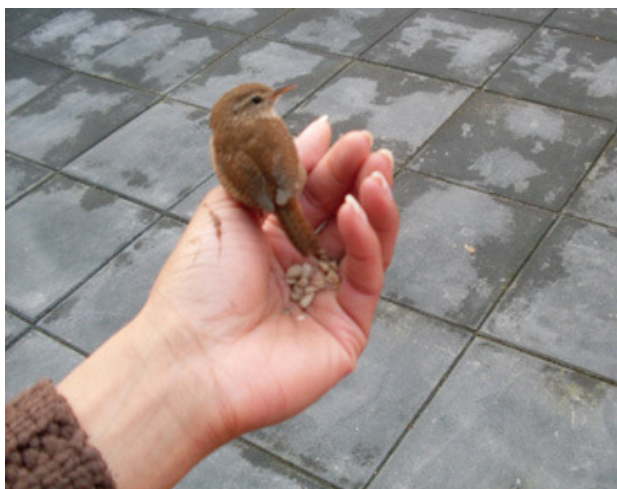
"Koninklijk bezoek, een winterkoninkje"

Een van onze leden houdt een website bij waarop zij op enthousiaste wijze verslag doet van haar avonturen met de vogels in en rondom het Sloterpark; van de sluwe roofvogel tot de piepkleine zangvogel. De belevenissen van Marjori met haar gevleugelde vrienden zijn te volgen op: www.gefladder.nl