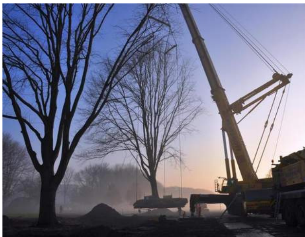
Bij zonsopkomst werd de 1e iep verplaatst

Met een indrukwekkende verplaatsing van de tweede iep heeft Paulus de Wilt op 23 november de feestelijke opening verricht van de Sloterparkbadsingel, ten zuiden van het Noorderhof. Van de drie monumentale iepen die altijd langs het oude fietspad hebben gestaan zijn er twee, met een stam van wel drie meter omtrek en volgens de deskundigen een gewicht van ieder zo'n 70 ton per hijskraan omhooggetrokken en langs het nieuw aangelegde fietspad opnieuw geplant.