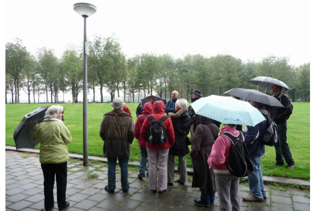
voet van de middelste Hogguerflat.

Na enig zoeken vinden wij vervolgens de zogenaamde Feromoonval op een lantaarnpaal aan de