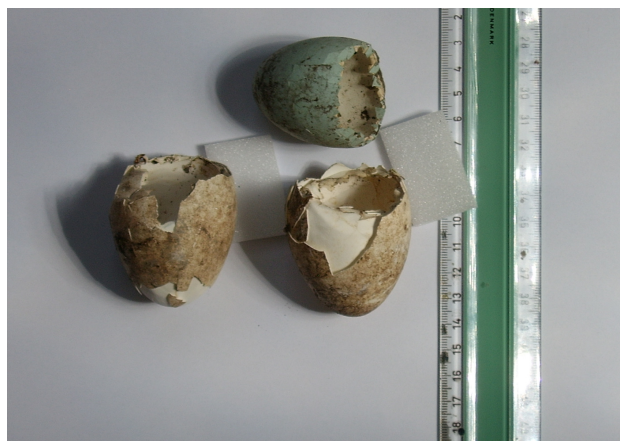
Eierschalen: twee van een lepelaar en een van een reiger.

mei werd gevoerd, na het festival nooit meer waargenomen en waren alle lepelaars op 13 juni vertrokken.