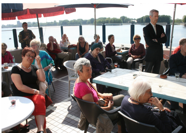
Viering 10 jaar VVS bij Café Oostoever

Ik kan u wel mededelen dat we langzamerhand tureluurs zijn geworden door alle beleids-, bestemmings-, uitwerkings- en structuurplannen; alle nota's, strategieën en visies waarop zienswijzen moesten worden ingediend en waarop moest worden ingesproken. Dan de rechtszaak onlangs, om te voorkomen dat er een hele dag onder de