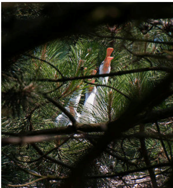
Vier jonge lepelaars.

het verloren gegane nest. Dat is niet zo verwonderlijk. Het stadsdeel was immers niet ingegaan op ons - achteraf gezien terechte - bezwaar tegen het afgeven van een vergunning voor een festival rondom de kolonie.