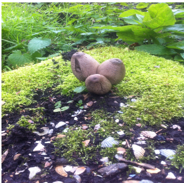
Toegift: de kapjesinktzwam

Na een serieuze waarschuwing om vooral geen risico's te nemen en nooit paddenstoelen te eten - behalve als je ermee bent opgegroeid, als je er een serieuze studie van hebt gemaakt of als je heel goed bekend bent met enkele eetbare soorten - gaan we op pad.