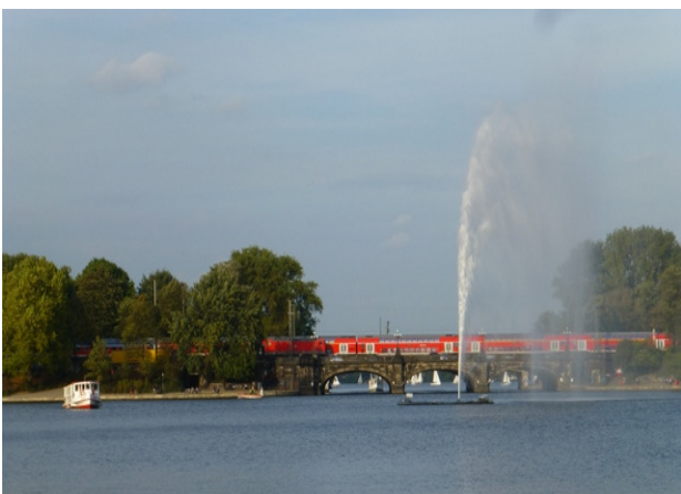
Binnen Alster

Hamburg is een bijzondere stad. Gelegen aan de Elbe heeft het een directe verbinding met de Noordzee. Zo heeft Hamburg zich van Hanzestad tot een wereldhaven kunnen ontwikkelen. Deze haven bevindt zich in het centrum van de stad aan de zuidzijde van de Elbe. De havenactiviteiten vormen een prachtig decor voor de bijzondere oude en nieuwe architectuur zoals Speicherstadt, Hafency en natuurlijk de Elbphilharmonie.