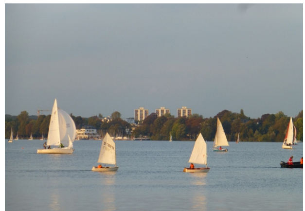
Buiten Alster

Wat een levendigheid op de plas: kano's, zeilboten. Overal kleine haventjes, uitspanningen waar wat gedronken kan worden. Veel hardlopers en net als in het Slotterpark ook trimtoestellen. Het leek wel of alle gezinnen van Hamburg die zonnige zondagmiddag rond de Alster aan het wandelen waren.