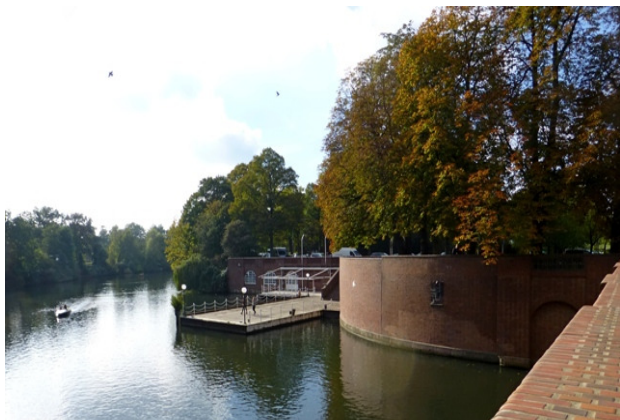
Bakstenen bastion

park (Stadtpark Verein): Reinhard, Marianne en Heide-Marie. Ze hadden een verrassing voor ons in petto: een prachtige wandeling met 2 gidsen door het park met als afsluiting "kaffee mit kuchen" in het Vereinhaus. De gidsen hebben ons alles verteld over het ontstaan van het park, de verwoestingen tijdens de Tweede Wereldoorlog, het herstel en het huidige gebruik van het park. Daarbij hebben ze ons vele historische foto's laten zien en vele anekdoten verteld.