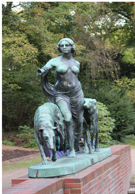
Één van de vele kunstwerken in het park

We hebben een ijsje gegeten in de grote speeltuin. We hebben de prachtige bloemen in het park bewonderd. Alle bloemen worden gekweekt in de eigen kwekerij. Een dergelijk kleurrijk geheel zou ook een prachtige toevoeging in het Sloterpark zijn. Ook de gebouwen in het park zijn onder architectuur gebouwd. We herkenden de baksteenarchitectuur van Fritz Schumacher zelf in de wassertoren (nu sterrenwacht) op het hoogste punt in het park, maar ook in de Trinkhalle voor het drinken van water (was in de jaren 1920 helemaal in de mode in Hamburg).