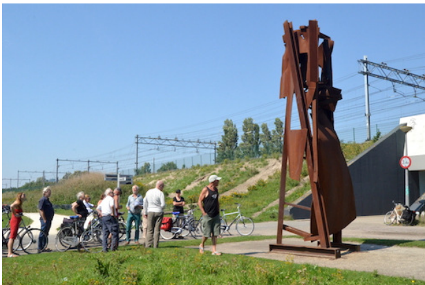
Kunstwerk van Herbert Nouwen aan het Overbrakerpad

Onze gids was Pieter Boekschooten die een grote rol heeft gespeeld bij de ontwikkeling van dit gebied. Over het Sloterdijkerpad, de voormalige spoordijk, fietsten we naar het Westerpark waar zich bij de kinderboerderij de vroegere werkplaats van de kunstenaar bevindt. Nouwens maakte zijn kunstwerken van schroot, afkomstig van scheepswerven en spoorwegwerkplaatsen. Het zijn grote abstracte roestige staalplastieken. Zijn 'Brettensuite' bestaat uit twintig plastieken (suites) te beginnen met twee werken bij de doorgang onder de spoorlijn naar Haarlem.