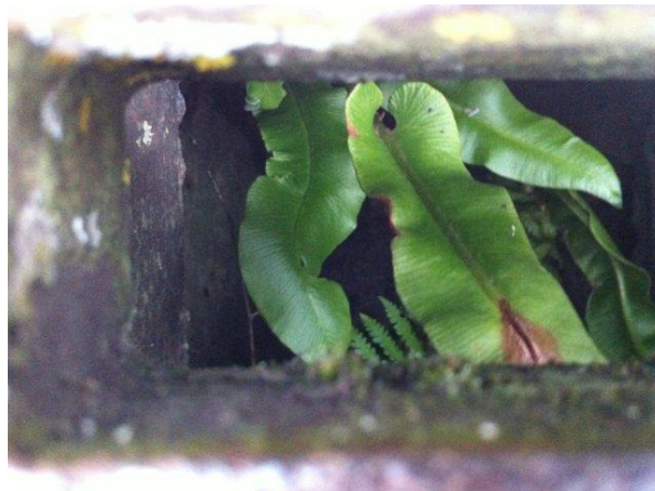
de Zwartsteelvaren ( Asplenium adiantum-nigrum ).

Het is bekend dat uit het metselwerk van de kademuur van de boulevard een zeldzame, beschermde soort varen groeit. Tot ieders verrassing bleek bij de voorbereiding van de aanpak van de boulevard dat ook onder de roosters in de afvoerputten twee soorten zeldzame en beschermde varens groeien: zie foto: de Tongvaren ( Asplenium scolopendrium ), en