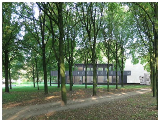
Artistimpressie Van Eesterenpaviljoen

van de boulevard een paviljoen gepland. Hiervan is alleen aan de oostkant Café Oostoever gerealiseerd. Aan de westkant bleef het een 'tijdelijk plantsoen'. In het Masterplan Slotterpark van 2004 werd op deze plek een paviljoen aangegeven. Zo ook in het Ruimtelijk Toetsingskader Slotterpark 2005, daarin heet het "gebouwde parkattractie".