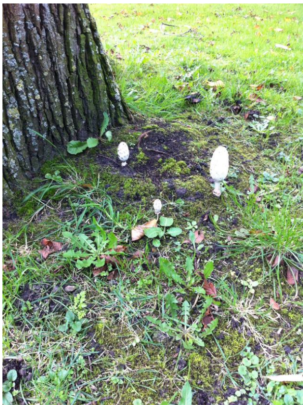
Inktzwammen? langs het Rondje oostzijde

Aan de noordoever, op een kavel die Cornelis van Eesteren bijna 80 jaar geleden al aanwezig voor een publiek gebouw, wordt met de realisatie van het Van Eesteren Paviljoen niet alleen deze droom maar ook een deel van het originele plan voor Slotermeer werkelijkheid. Het paviljoen is tot stand gekomen na vele jaren van plannen en voorbereidingen én dankzij de inspanningen van medewerkers, vrijwilligers en financiers.