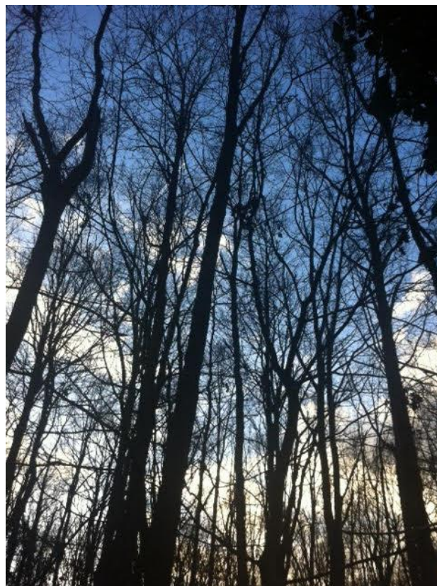
Gezonde eiken met veldesdoorns

"Er moet in een enkel geval, hier en daar wel wat gebeuren".