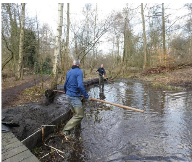
Handmatig baggeren van de waterpartijen