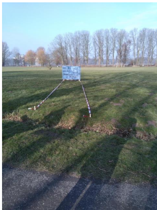
Bewonersprotest tegen ongewenste paden

Voor de overige onderwerpen zie agenda op de achterzijde