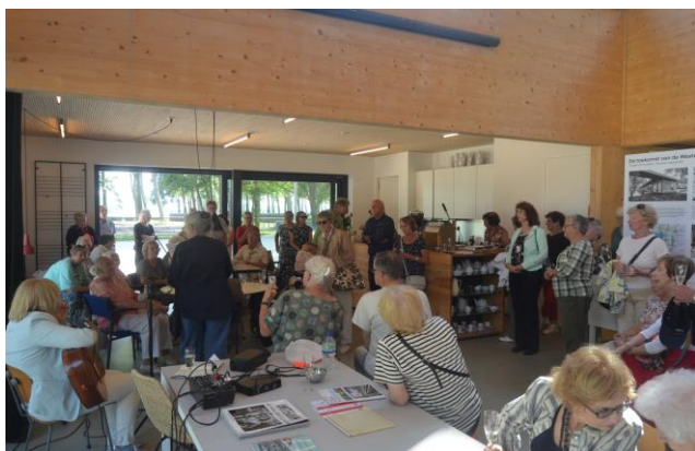
Viering 3 e lustrum in het Van Eesterenmuseum

Maar nu ben ik alweer op mijn stokpaardje terecht gekomen, net als 5 en 10 jaar geleden op het terras van café Oostoever (zucht). Terug naar Van Eesteren. Om de plas heeft hij een landschappelijk park bedacht met bos, weiden, struikgewas en heuvels zodat op veel plaatsen de natuur zijn gang kan gaan. Die natuur die ons zo vaak verrast.