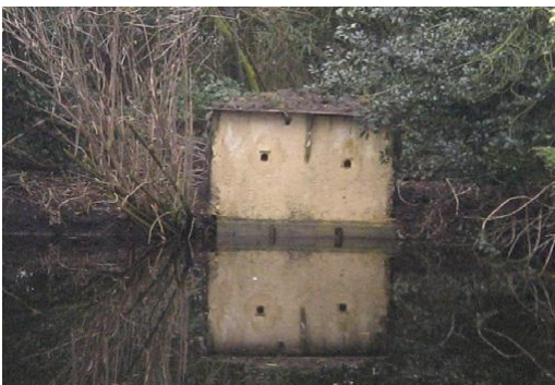
Kunstwand Nemo Westerpark

Onlangs kregen we het bericht dat de ijsvogels afgelopen winter vermoedelijk allemaal overleden zijn door de kou, maar inmiddels zijn er gelukkig weer nieuwe vogels rond de Sloterplas gezien.