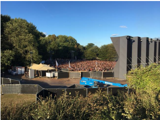
Een deel van het festivalterrein, gezien vanaf de heuvel met het kunstwerk van Wessel Couzijn

Zoals ieder jaar hebben wij onze klachten over het Loveland festival (11 en 12 augustus) naar het stads(deel)bestuur gestuurd ( zie voor de volledige versie onze website ).