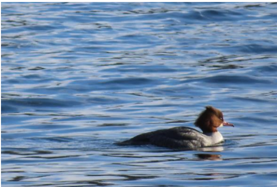
grote zaagbek (vrouwetje)

Het is dus goed vogels kijken in het Sloterpark, het is leuk om eens goed om je heen te kijken en je te laten verrassen door de vogels van het Sloterpark.