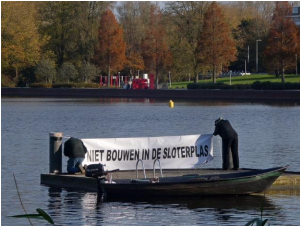
De VVS hangt op 9 november een spandoek op