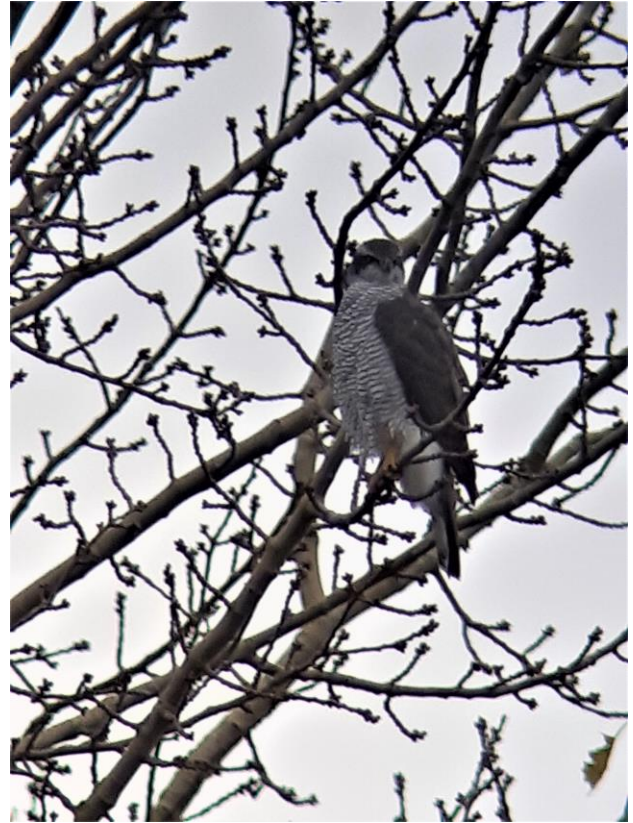
De Havik op eiland voor het Sloterparkbad 26/11/2020

Net als mossen heeft de eikvaren dus water uit de lucht nodig. Dauw en mist helpt, maar regenval is het beste. Het mos waarin ze groeien houdt als een spons vocht vast, en daar profiteert de eikvaren van. In droge periodes staan het mos en de varens er desondanks dor bij. Het einde lijkt dan weleens nabij, maar is dat bijna nooit. Al zullen ze in zo'n lange hete zomer wel eens een blaadje laten vallen, na regenval is de varen in korte tijd weer helemaal frisgroen, net als het mos. Een veerkracht die ik jullie allemaal ook toewens in het nieuwe jaar. En dat we dan weer eens gezamenlijk op excursie kunnen langs de bijzonderheden in het park.