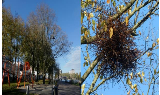
Heksenbezem in een iep bij de wandelboulevard tussen Meer en Vaart en Slotterplas

Niet alles wat een nest lijkt, is overigens een nest. Twee bijzonderheden aan Amsterdamse bomen waren laatst in het nieuws. Allebei vanuit de binnenstad, maar ook te zien rond onze Slotterplas. Allereerst de redding van de heksenbezemiep op het Waterlooplein (zie https://www.at5.nl/artikelen/205362/ ). Voor de herinrichting zijn 24 bomen gekapt, maar is één iep gespaard. In deze iep zat een zogeheten heksenbezem. En dat is bijzonder. De boom maakt in een enkele tak een groot aantal zijtakjes die meestal alle kanten opgaan met de toppen naar buiten. Daaraan zie je ook dat het geen nest is. De heksenbezem wordt veroorzaakt door een schimmel of bacterie. In berken zie je ze veel, maar in iepen zijn ze zeldzaam. Toch staan er rond onze Slotterplas minstens vier iepen met een heksenbezem. Zoek ze allemaal.