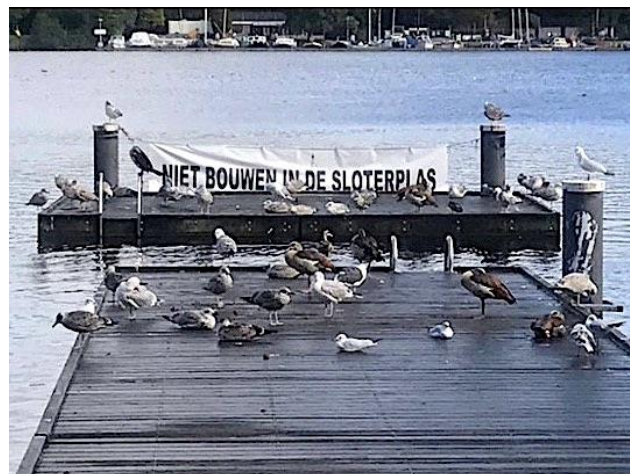
De meeuwen bewaken ons spandoek

Intussen blijft de onvrede met de waterlocatie van de Meervaart terugkomen, ook in de pers.