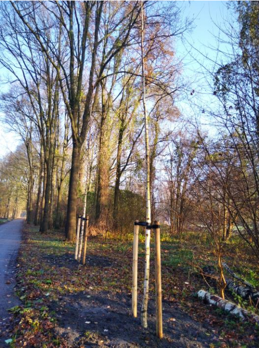
2 nieuwe berken langs Rondje

Bij de derde ingang van het park stuit het Rondje op een bosvak. Binnen dit bosvak aan de zuidzijde bevindt zich een open plek, die de Huiskamer wordt genoemd. Om het gebruik van die plek als ontmoetingsplaats te bevorderen, wil de gemeente deze ruimte aan de boszijde omringen met Amerikaanse krentenboompjes en eventueel inheemse heesters; het gras zal vaker worden gemaaid en de kapotte bank wordt vervangen. Hier eindigde onze wandeling, er zullen zeker meer volgen.