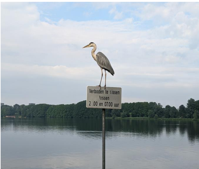
Kunnen reigers lezen?