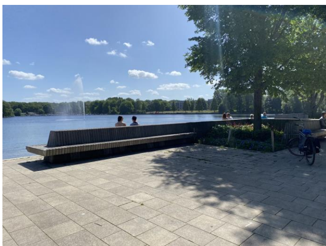
Genieten van het vrije uitzicht