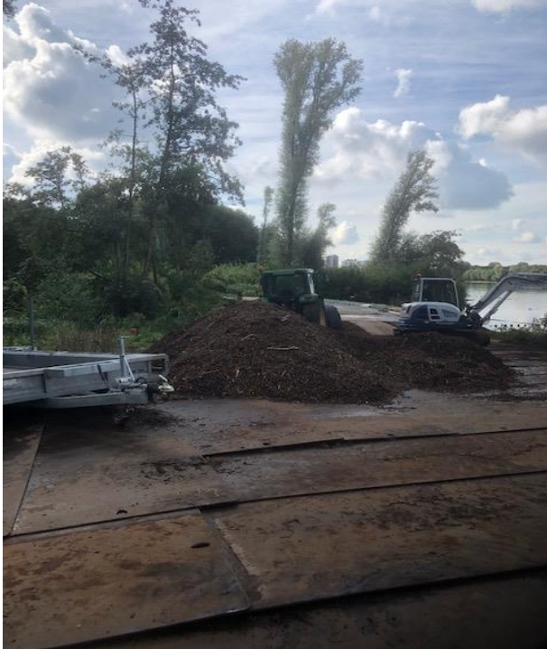
Brug naar eiland t.b.v. kap 1 e eiland