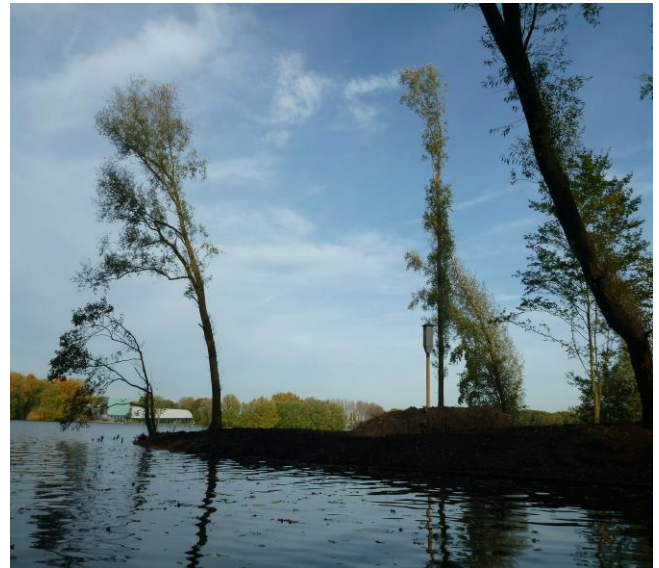
Kaalslag bomen en plaatsing vleermuizenpaal.

haalbaar is om direct de waterkwaliteit rondom de eilanden te verbeteren. Nieuwe resistente iepen zijn inmiddels besteld, maar deze zijn pas in de winter van 2024/2025 leverbaar.