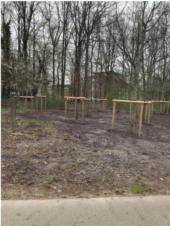
Verplaatst van oever Chr. Plantinggracht naar de oostzijde van de zonneweide

gekenmerkt door de palen die er ter bescherming omheen staan.