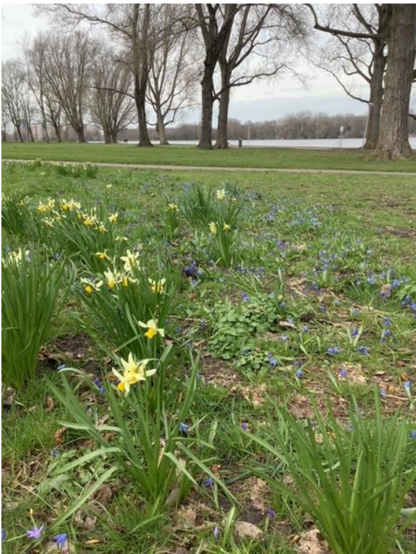
Het voorjaar komt langzaam op gang!

Het drijvende onderzoekseiland midden in de plas wordt overigens binnenkort weggehaald.