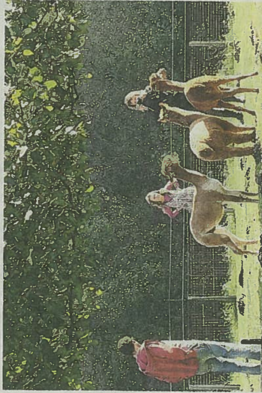
De kinderboerderij in Geuzenveld heeft lama's.

Bij de kinderboerderij in Geuzenveld vermaken gezinnen zich met de lama's en boven hen is het dak van een echte ouderwetse hooiberg te zien. Het is mooi weer vandaag, onder