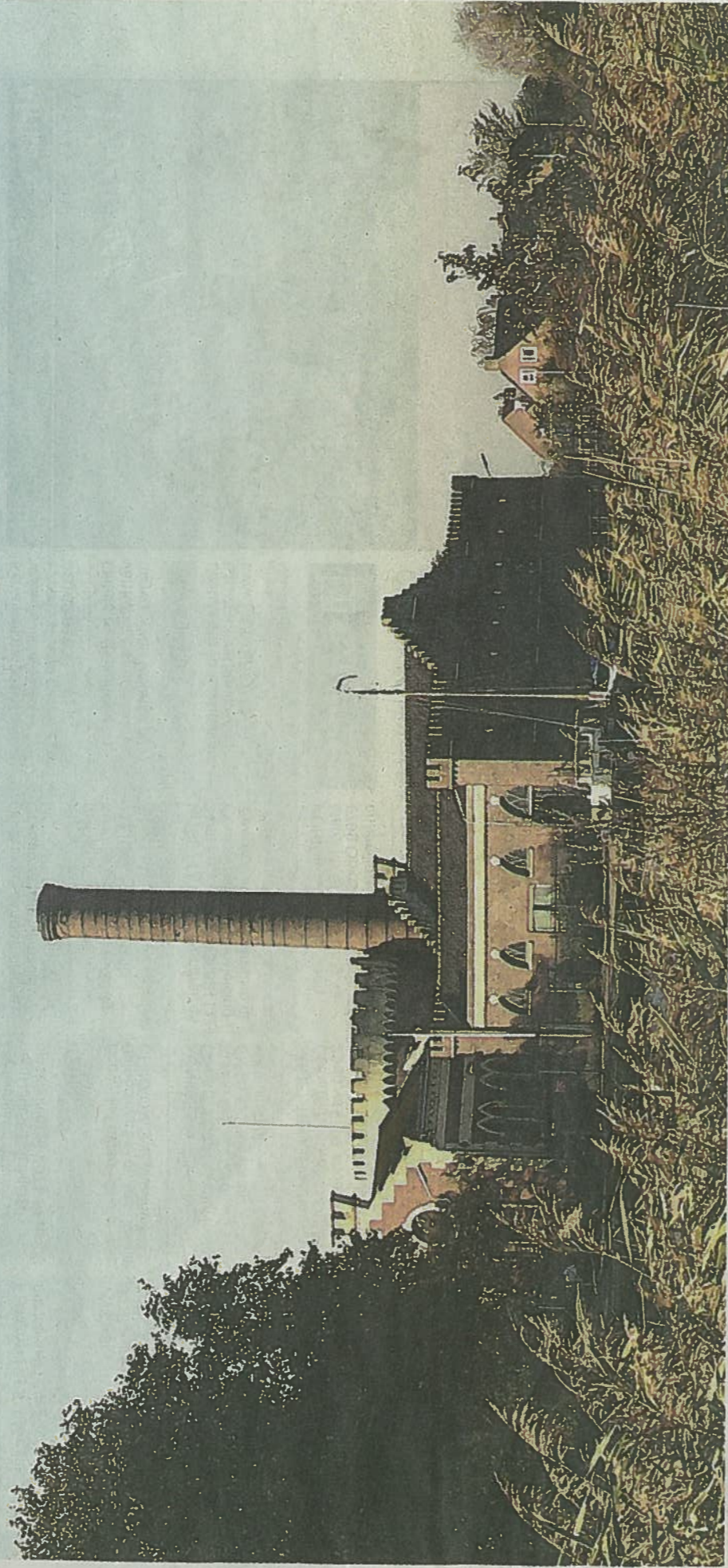
Het gemeaal van Lynden lijkt wel een kasteel, met zijn torens en kantelen.